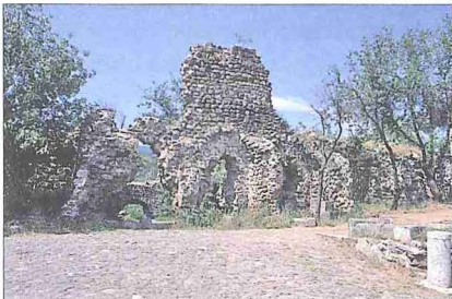
Niksar'da Yağbasan Medresesi'nin kalıntıları ve Melik Gazi Türbesi