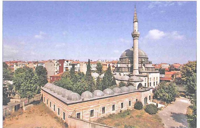
Nişancı Mehmed Paşa Camii - Fâtih / İstanbul