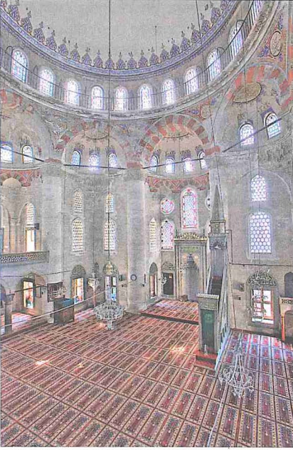
Nişancı Mehmed Paşa Camii'nin içinden bir görünüşü

zâviye / tekke ilâve edilmiştir. Medreselerle tekkesi günümüze ulaşmamıştır. Yapıyı III. Murad devri kubbe vezirlerinden Mehmed Paşa (ö. 1003/1594) son iki nişanlılığı arasında ikinci vezir iken yaptırmıştır.