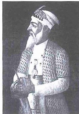
Nizâmülmülk Âsafcâh'ın yağlı boya portresi