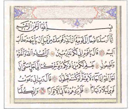
Nüh sûresinin ilk âyetleri

Sûrenin ikinci bölümü (âyet 21-28) Hz. Nüh'un kavmi hakkında rabbine olan şikâyetiyle başlar. Zira Nüh uzun yıllar (el-Ankebût 29/14) kavmiyle birlikte bulunarak kendilerini hakka çağırması, fakat onların büyük çoğunluğu servet ve taraftar sahibi inaçsızların yanında yer almış, çeşitli hile ve tuzaklar kurarak Nüh'u susturmak istemiş, Ved, Süva', Yegûs, Yeûk, Nesr diye isimlendirilen putlara tapmayı sürdürmüş ve birçok kişiyi hak yoldan saptırmıştır. Bölümün son âyetlerinde Hz. Nüh'un, islah olmayacağı kanaatine vardığı bu insanların yok edilip nesillerinin kurutulmasını Cenâb-ı Hak'tan talep ettiği, bunun üzerine onların suda boğulduğu ifade edilir. Sûre Hz. Nüh'un kendisinin, anne ve babasının, aile fertlerinden mümin olanların