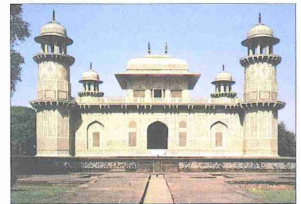
Nurcihan'ın Agra'daki türbesi

1031'de (1622) Safevîler'den Şah Abbas Kandeher'i istilâya kalkışınca Cihangir Şah, Hürrem'i ona karşı sefer düzenlemekle görevlendirdi. Ancak Hürrem önce Pencap'ın kendisine verilmesini talep edince Cihangir diğer oğlu Şehriyâr'ın rütbesini yükselterek bu işle onu görevlendirdi. Bu arada Kandeher kırk beş günlük direnişin ardından Şah Abbas'ın eline geçti. Cihangir Şah'ın şehrin kayboldan sorumlu tuttuğu Hürrem isyan ederek Agra'ya doğru yöneldi. Nurcihan'a karşı olan bazı kumandanlar da Hürrem'i destekledi. Bunun üzerine Nurcihan, Cihangir Şah'ı Agra'ya yürütmesi için ikna etti. Sultanın gelmesiyle Agra'daki rahatsızlıklar ortadan kalktı. Nurcihan, sadakatinden şüphelendiği Kâbil Valisi Mehâbet Han'ı Hürrem'e karşı savaşa çağırarak kendisini sınamak istedi. Hemen Delhi'ye gelen Mehâbet Han üç yıl kadar devam eden iç savaş sonunda Hürrem'i mağlûp etti. Hürrem'in tekrar isyan etmesini önlemek için oğulları Dârâ Şükûh ve Evrengzib rehin alındı. Mehâbet Han'ın Şehzade Pervîz ile yakınlığından rahatsız olan Nurcihan, Mehâbet Han'ı Bengal valiliğine tayin ettirip Delhi'den uzaklaştırdı. Ardından itibarını iyice kırmak için ondan ağır vergiler istedi. Bu durumdan şüphelenen Mehâbet Han, Cihangir Şah ile konuyu görüşmek için askerleriyle yola çık-