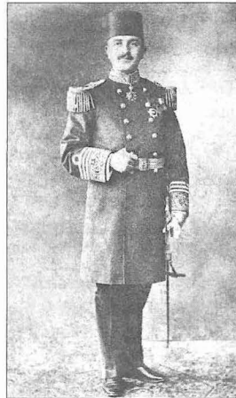
Hüseyin Rauf Orbay 1923 yılında Ankara'da Milli Mücadele sırasında askerî kıyafetiyle