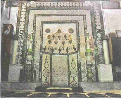
Ortahisar Camii'nin mihrabı