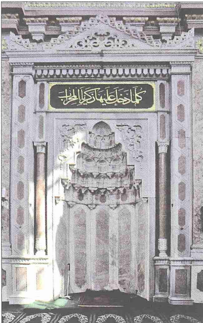
Ortaköy Camii'nin mihrabi