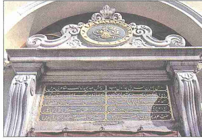
Ortaköy Camii'nin kitabesi

Yapıda harimle hünkâr kasrı arasında tasarım ve yüzeylerin ele alınışı bakımın-