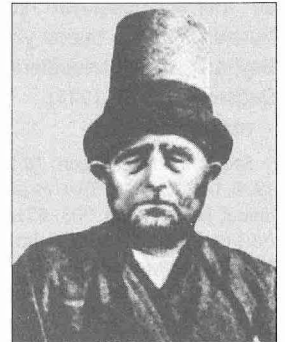
Musullu Osman Dede Efendi