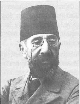
Osman Hamdi Bey

30 Aralık 1842'de İstanbul'da doğdu. Sadrazam İbrâhim Edhem Paşa'nın oğlu, Halil Edhem (Eldem) ile İsmâil Galib'in ağabeyidir. Çok yönlü bir kişi olarak yetişmesinde ailesinin önemli rolü olmuştur. İlköle Beşiktaş'ta başladı ve 1856'da Mekteb-i Maârif-i Adliyye'ye kaydoldu. 1857'de hukuk tahsili için Paris'e gönderildi. Bura-