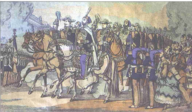
Sultan Abdülaziz'i 1867 Avrupa seyahatinde Paris'te III. Napolyon ile beraber tasvir eden bir tablo (İstanbul Deniz Müzesi)

Sultan Mehmed Reşad'ın ölümü üzerine (3 Temmuz 1918) son Osmanlı padişahı olan VI. Mehmed Vahdeddin felâketli bir dönemde tahta çıktı. Filistin-Suriye ve Irak cepheleleri çökmüş, Bağdat (11 Mart 1917), Kudüs (11 Aralık 1917), Şam (1 Ekim 1918), Halep (27 Ekim 1918), İngilizler'in; Beyrut (6 Ekim 1917), Trablusşam, İskenderun (14 Ekim 1917) Fransızlar'ın eline geçmişti. 1918 yılında devam eden askerî harekât durumu daha da ümitsizleştirdi. Nihayet Bulgarlar'ın savaşın çekilmek zorunda kalmaları genel çöküntüyü daha da hızlandırdı. Batı cephesindeki ağır yenilgiler ve içte beliren ihtilâl karışıklıkları üzerine Almanya ve dağılan Avusturya-Macaristan da mütarekeye yanaştı (3-4 Kasım 1918). Sadrazam Talat Paşa, Osmanlı Devleti için de mütareke yollarını açabilmek amacıyla istifa et-