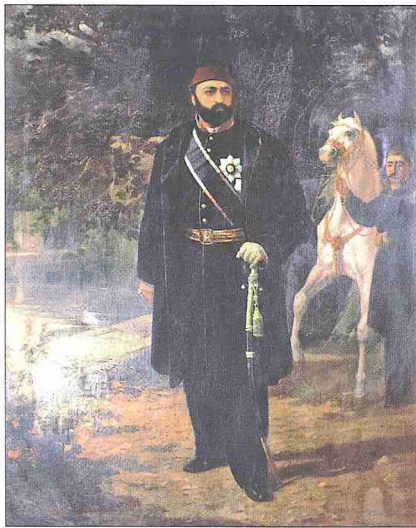
Sultan Abdülaziz’i saray bahçesinde tasvir eden yağlı boya tablo (TSM, nr. 17/104)

Berlin Antlaşması, Doğu Anadolu’da Ermeniler’le meskûn olan altı vilâyette (Erzurum, Van, Bitlis, Diyarbekir, Sivas, Ma’mûre-