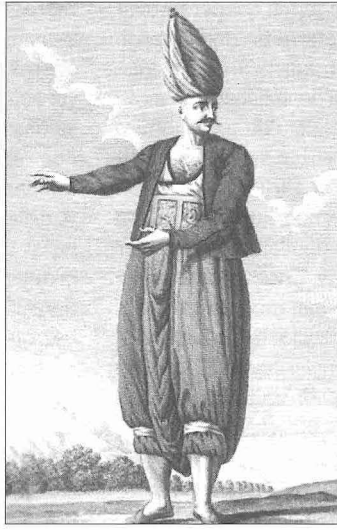
Karakullukçu ve aşçı (D'Ohsson, Tableau général , III, iv. 196, 199)

sında Yeniçeri Ocağı'nın ilgası arefesinde kuruldu, fakat büyük tepki çekti ve yine bir askerî ayaklanma ile son buldu. 15 Haziran 1826 tarihinde Yeniçeri Ocağı'nın kaldırılmasının ardından kurulan Asâkir-i Mansûre-i Muhammediyye devletin sonuna kadar devam eden ilk tâlimli ordu oldu ve günümüz modern Türk ordusunun nüvesini teşkil etti. Teşkilât itibarıyla Nizâm-ı Cedid ordusuna benzeyen Asâkir-i Mansûre-i Muhammediyye'nin en büyük kumandanına serasker unvanı verildi. Bölük kumandanları binbaşı unvanıyla anıldı. Daha aşağıda yüzbaşı ve mülâzımlar vardı. Zamanla yapılan düzenlemelerle yeni rütbeler ihdas edildi ve günümüz askerî makamlarına yakın bir hiyerarşi ortaya çıktı. Yeni ordunun takviyesi için taşrada ayrıca yedek güç olarak redif birlikleri oluşturuldu, 1834'te subay ihtiyacını karşılamak için Harbiye Mektebi açıldı. Zamanla Anadolu'nun ve Rumeli'nin bazı merkezlerinde de kurulan Asâkir-i Mansûre'nin adı Sultan Abdülmecid döneminde Asâkir-i Nizâmiyye'ye çevrildi. Tanzimat Fermanı'nın ilânından sonra askerî alanda da gelişmeler oldu. Askere almada kura usulü benimsendi ve muvazzaf askerlik süresi kısaltıldı. Sultan Abdülaziz devrinde hassa alayları kuruldu, yeni bir askerî kıyafet benimsendi ve askerî okulların islahına çalışıldı. II. Abdülhamid döneminde devam ettirilen askerî yenilikler kapsamında Osmanlı kara kuvvetleri günümüzde varlığını sürdüren ordulara ayrıldı, Doğu Anadolu'daki aşiretlerden Hamidiye Süvari Alayları kuruldu.