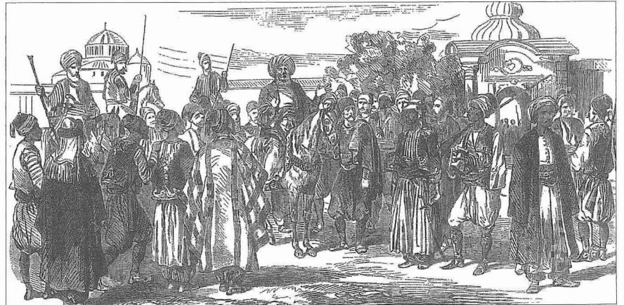
Kırım savaşı esnasında Beyazıt Meydanı'nda imâmî dinleyen ahaliyi tasvir eden gravür (l'illustration Journal Universel, Paris 1854, XXIV, 52)

Osmanlı toplumunda dinî günlerin ve bayramların ayrı bir yeri vardı. Hz. Peygamber'in doğum yılı dönümü münasebetiyle evlerde ve camilerde yapılan mevlid törenleri yanında padişahların katıldığı mevlid merasimleri de büyük önem taşırdı (bk. MEVLİD). Muharrem ayının 10. gü-