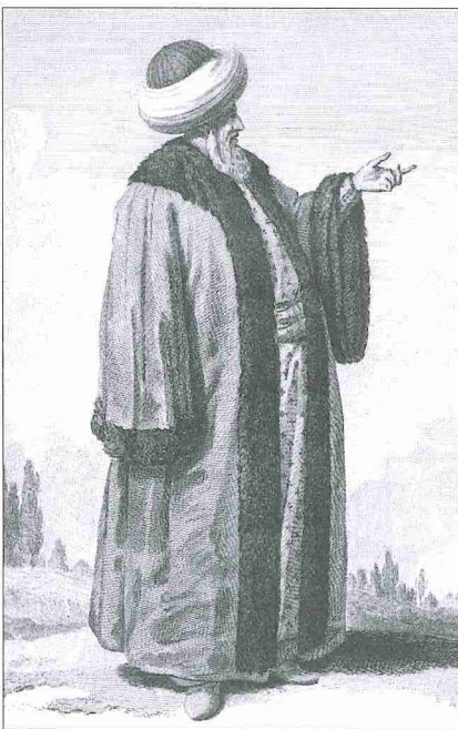
İmam (D'Ohsson, Tableau général , II, lv. 100)

Mescid ve cami görevlileri vazifelerini hastalık ve ihtiyarlık gibi sebeplerle başkalarına devredebilirdi. Vefat halinde görev genellikle vefat edenin oğluna veya bir yakınına verilmekte, ancak bunda ehliyete dikkat edilmekteydi. İmamlık küçük yerlerde daha çok babadan oğula veya diğer aile fertlerine intikal eden bir görevken büyük yerleşim yerlerinde bu hususta dinî bilgi ve yeterlilik ön planda tutulmaktaydı. Hatiplik görevi yapacak kişilerin imamlara nisbetle daha iyi bir eğitim almış olması gerekmektedir. Askeriyedeki imamlarda da iyi bir eğitimin arandığı anlaşılmaktadır. Cami görevlileri kadıların kontrolü altındaydı. Şikâyetler kadılar tarafından değerlendirilir ve gerektiğinde ceza verilir-