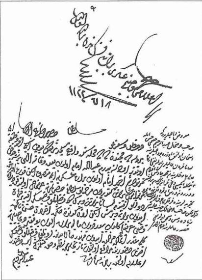
Bursa'da imtihanla imam tayin edilmesiyle ilgili bir belge (BA, Cevdet-Evkaf, nr. 11266)

nünden itibaren aşure pişirilerek dağıtılır, çeşitli vesilelerle mevlid okutulurdu. Konaklardaki mevlid merasimlerinde Kur'an okunur ve dualar yapılır, misafirlere çeşitli ikramlarda bulunulur, mübarek gecelerde sakal-ı şerif ziyaret edilirdi. Ramazan aylarında gündelik hayatın seyrinde de bir değişiklik hissedilirdi. Ramazan başlangıcının ve sonunda bayramın ilânı için hilâl gözlenir ve kadı huzurunda şahitlerle tesbit edilirdi. Ramazan ayında halka ve medrese öğrencilerine, tekkelere ve medreselere para ve erzak yardımı yapılırdı. Toplumun her kesimi ramazanı büyük bir coşkuyla karşılar, ibadetin yanında ramazan ayına mahsus faaliyetler ve eğlenceler düzenlenirdi. Ramazan başlamadan önce camiler temizlenir ve aydınlatılır, minarelere mahyalar kurulurdu. Selâtin camilerinin avlularında tesbih, mushaf, kitap vb. eşya ile iftarlıklardan oluşan sergiler açılırdı. Camilerde Kur'an tilâveti yanında tefsir dersleri de verilirdi, vaazlar yapılırdı. Ramazan akşamlarında vezir ve eşraf konaklarında mükellef iftar sofraları kurulur, gelen misafirlere ayrıca çeşitli hediyeler verilirdi. Sahur için de benzer hazırlıklar yapılır ve misafirlere ağırlandı. Ramazanlarda özellikle XIX. yüzyılda Batı tesiriyle yeni bir zihniyetin ortaya çıkmasından sonra Karagöz ve orta oyunları gibi eğlenceler de tertip edilirdi, İstanbul halkının bir kısmı iftardan sonra Direklerarası'nda yapılan eğlencelere katılırdı.