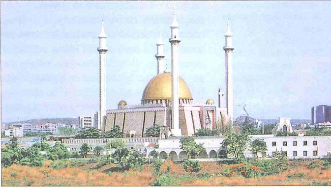
Abuja Camii – Nijerya

yapıya sahip olan Nijerya'da 175 civarında dil konuşulmaktadır. Nüfusun çoğunluğunu oluşturan müslümanların mevlid kandili, ramazan ve kurban bayramları ile hıristiyanların Paskalya ve Noel bayramları, ülkenin bağımsızlığını elde ettiği 1 Ekim günü, yılbaşı ve 1 Mayıs işçi bayramı resmî tatil günleridir. Kur'an okullarında temel İslâmî eğitim alan müslüman çocukları daha sonra ilk ve ortaöğretim seviyesinde eğitim veren medreselerde öğrenimlerini sürdürürler. Nijerya Afrika ülkeleri içerisinde Fas, Cezayir, Mısır, Sudan ve Güney Afrika ile birlikte en fazla üniversiteye sahip ülkelerden biridir. Ülkedeki ilk üniversite İngilizler tarafından 1948'de İbadan'da açılmıştır. Abubakar Tafawa Balewa University, Pan-African University, University of Abuja, University of Ibadan, University of Ilorin ve Usmanu Dan Fodiyo University diğer üniversiteler arasında sayılabilir.