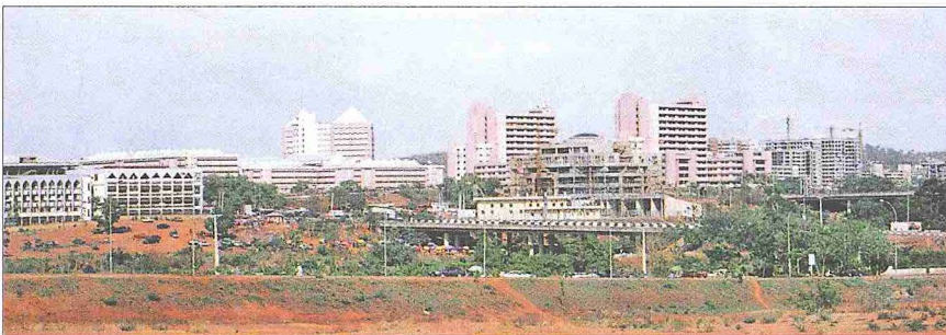
Nijerya'nın başşehri Abuja'dan bir görünüşü

Çok farklı etnik ve dinî toplulukların yaşadığı, dolayısıyla çok kültürlü bir sosyal