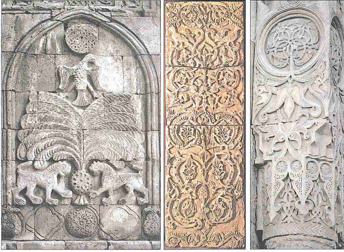
Bazı taş oyma örnekleri: Erzurum Yâkutiye Medresesi'nde taşa oyma pano; Toledo'daki Mamun Sarayı'ndan bitki ve hayvan figürlü kabartma levha; ve Divriği Ulucamii'nin batı kapısından detay

Asya'da zamanla bu ustaların etkisiyle bir Türk-Çin ortak üslûbu oluşmuş ve bu üslûbu yansıtan bazı eserler günümüze ulaşmıştır.