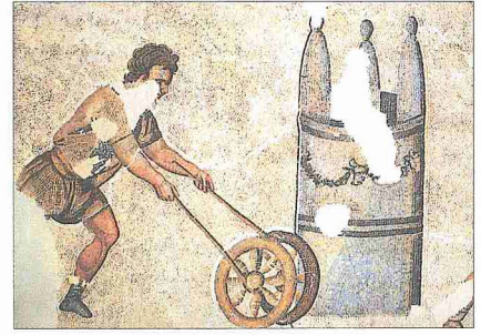
İstanbul Sultanahmet'teki Büyük Saray'ın mozaiklerinde tekerlek çeviren çocuk figürü

Oyun denilince öncelikle çocuk akla gelir. Çocuğun zekâ gelişimi ve şahsiyet terbiyesinde, yeteneklerinin ortaya çıkmasında, cinsel eğitiminde oyunun önemli rolü