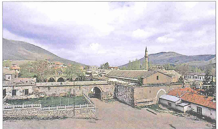
Ulukışla Öküz Mehmed Paşa Külliyesi

Külliye'nin büyük boyutlu yapısı olan kervansaray düzgün kesme taş ve moloz taş malzeme ile inşa edilmiş olup biri kuzeyde, diğeri güneyde iki ayrı bölümden meydana gelmektedir. Arastanın kuzeyinde bulunan ve avlulu olan bölüm kareye yakın dikdörtgen bir alanı kaplamaktadır. Avlu güneye, kapalı mekânlar ise kuzeye yerleştirilmiştir. Dikdörtgen planlı avlu güneyinde yer alan bir kapı ile arastaya bağlanmaktadır. Doğu ve batı yönünde dörder pâyeli, çapraz tonoz örtülü ve ocaklı revaklar vardır. Revakların kuzeyinde dışa açılan birer küçük kapı mevcuttur. Batıdaki revakin güney birimi sonradan kapıya dönüştürülmüştür. Avlunun kuzeyinde kervansarayın kapalı bölümüne bitişik olarak bir sıra halinde beşik tonoz örtülü sekiz birim bulunmaktadır. İki yanda simetrik olarak yerleştirilen bu mekânlardan birer tanesi avluya açılan eyvan, diğerleri odadır. Ortada yer alan kapı ile kapalı bölüme geçilmektedir. Doğu-batı doğrultusunda dikdörtgen planlı olan bu mekân ortada altı pâyeli bölümlenmiş iki beşik tonozla örtülüdür. Mekânın uzun kenarlarında önleri sekili (güneydeki mevcut değil) ocak nişleri görülür. Dıştan üçgen alınlıklı cepheli kısa kenarlarda mazgal açıklıkları vardır. Bu mekânın güneydoğu ve güneybatı köşelerinde yer alan birer kapı ile beşik tonozlu birimlere geçiş sağlanmıştır. Kervansarayın kapalı bölümü altında samanlık birimlerinin bulunduğu belirtilmektedir. Arastanın güneyinde yer alan ve kuzey-güney istikametinde dikey yerleştiril-