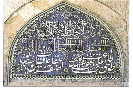
Ömer Paşa Camii'nin çini pencere alınlıklarından biri

Elmalı ilçesinin ortasında yer alan cami, kapısı üstündeki kitâbesine göre 1019 (1610) yılında Ketencizâde Ömer Paşa tarafından yaptırılmıştır. Manzum kitâbe-