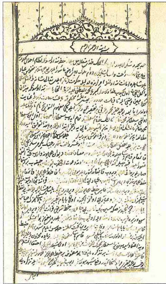
Örfî Mahmud Ağa'nın Mefhûmü't-tevârih adlı eserinin II. cildinin ilk iki sayfası (Millet Ktp., Ali Emîrî Efendi, Tarih, nr. 558)