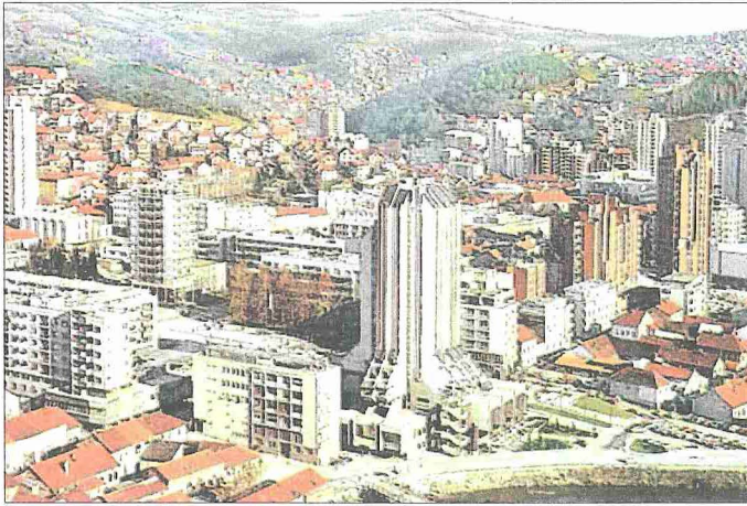
Özice'den bir görünüşü

ta Avrupa şehir planı ve mimari tarzında tekrar inşa edildi. Müslümanlara ait tarihi eserler arkalarından hiçbir iz bırakılmadan ortadan kaldırıldı.