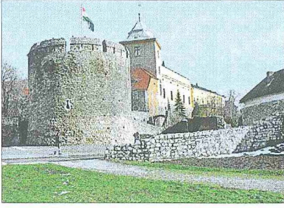
Peçuy Kalesi'ne ait bir burç

sek dağlarının güney eteklerinde kurulmuştur. Burası Eskiçağ'dan beri bir yerleşim merkezidir. Romalılar zamanında Sopianae (II. yüzyılın sonu ve IV. yüzyılın ortası) ismiyle tanınıyordu. Keltler ve Avarlar'ın ardından Macar yerleşimine sahne oldu. Salzburg piskoposu daha IX. yüzyılda burada bir kiliseyi kutsamıştı. Bu sırada adı Quinque Basilicae (Beş Kilise) idi, bu ad daha sonra Quinque Ecclesiae'ye dönüştü. Şehrin Almanca ismi de bu kelimeye dayanır. Macar Kralı Aziz (I.) İstvân, Peçuy Piskoposluğu'nu 1009'da burada kurdu. 1181 tarihli bir belgede şehre göç eden Alman, Fransız ve Latin kökenli yabancılardan söz edilir. Macarca Pécs adı ilk defa 1290 tarihli bir belgede görülür. Şehrin efendisi ve sahibi XVIII. yüzyıla kadar Peçuy piskoposu idi; şehrin bölgede oynadığı rol ve kentsel karakteri onu "özgür krallık kentleri"ne (civitas libera regia) benzer hale getirmişti. İlk katedrali (Szent Péter Bazilikası) Peçuy'un ikinci piskoposu olan Szent Mór inşa ettirdi, Macarlar'ın ikinci kralı Péter Orseolo da buraya gömüldü. Piskoposluk ikametgâhı 1242 yılındaki Tatar (Moğol) hücumları sırasında yakıldı. Bu yüzden Tatar istilasından sonra şehir surlarla çevrildi ve piskoposluk sarayı bir kaleye dönüştürüldü. Macaristan'ın 1367'de kurulmuş olan ilk üniversitesi bu kalenin içinde yer alıyordu.