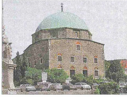
Kasım Paşa Camii – Peçuy

Osmanlı dönemi Peçuy'u -pek çok Macar şehrinde farklı olarak- hem mimaride