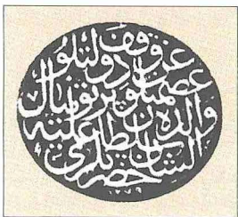
Pertevniyal Vâlide Sultan Kütüphanesi'nin vakıf mührü

La Caduta di Costantinopoli adlı büyük eseri 1976'da ilim âlemine sunulmuş, daha sonra tıpkıbasımları yapılmıştır. Neşirini göremediği ek cildi, öğrencisi A. Carile tarafından uzun bir giriş yazısıyla birlikte Testi inediti e poco noti sulla caduta di Costantinopoli adıyla neşredilmiştir (Bologna 1983). Bu külliyyatın I. cildi İstanbul'un fethine doğrudan şahit olup izlenimlerini kaleme alan kişilere ayrılmıştır. II. cildin alt başlığı "İstanbul'un Fethinin Dünyadaki Yankısı" biçimindedir. Fethi doğrudan şahit olmayanların eserlerinden hareket edilip bir asır sonra fethi kitabında geniş yer veren Hoca Sâdeddin'e kadar kişilerin konuyu ele alış şekillerini tahlil eder. III. ciltte ilk iki ciltte belgelerle