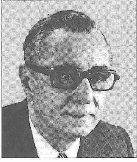
Perviz Nâtil Hânleri

de yayımlandı. Bediüzzaman Fürûzanfer, Bahâr, Saîd-i Nefîsî ve Abbas İkbâl-i Âştî-yânî gibi üstatlardan ders aldı. Fürûzanfer'in danışmanlığında Fars aruzu üzerine hazırladığı doktora çalışmasını 1943'te tamamladı. Aynı yıl, 1979'a kadar devam eden edebiyat ağırlıklı aylık Sûhan adlı dergiyi çıkarmaya başladı. 1948-1950 yılları arasında Sorbonne Üniversitesi'nde yüksek dil bilimi eğitimi gördü ve güzel sanatlar bölümünün derslerine katıldı. Dönüşünde İçişleri bakan yardımcılığına getirildi. 1957'de Amerika'dan aldığı bir davetle görevinden ayrılıp oraya gitti ve çeşitli üniversitelerde bilimsel etkinliklerde bulundu.