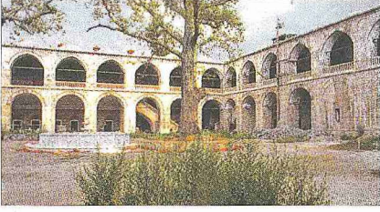
Pirinç Hanı'nın avlusundan bir görünüşü

1088 (1677) tarihli bir belgeden odaların tuğla döşemelerinin, pencerelerin ahşap kısımlarının, ocakların, hatılların, üzerine döşenen kurşunların, ahırın kemer ayaklarının ve merdivenlerinin, taçkapının çatısının tamir edildiği, bu esaslı tamire toplam 113.350 akçe harcandığı anlaşılmaktadır. XVII. yüzyılda âdet olduğu üzere bu hanın da kurşunlarının satılarak üzerinin kiremitle kaplandığını bazı müellifler belirtirlerse de bununla ilgili bir belgeye henüz rastlanmamıştır.