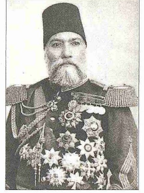
Gazi Osman Paşa

Gazi Osman Paşa'nın bu galibiyetlerden sonra Rus ordusuna karşı en büyük zaferi 11 Eylül 1877'de kazanmış olduğu III. Plevne Muharebesi'dir. Yenilgi neticesinde Rus liderlerini karamsarlık ve kendilerine güvensizlik sarmış, hatta Grandük Nikola Tuna'nın gerisine çekilmeyi teklif etmiş, fakat imparator ve Rus savaş bakanı Milivtin tarafından bu fikrinden vazgeçirilmiş-