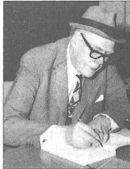
Arthur Upham Pope