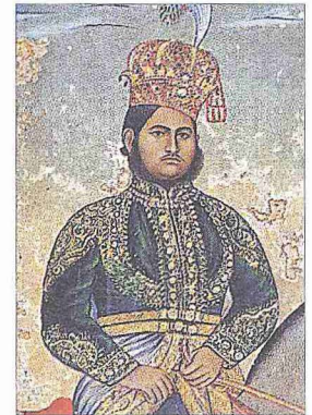
Râmpür nevvâblarından Kelb Ali Han'ın bir tasviri

Modern Hindistan'da Utar Pradeş eyaleti arazisinin kuzeybatısını teşkil eden Râmpür idarî bölgesi 2318 km 2 lik bir alanı kaplar ve 1.923.739 (2001) nüfusa sahiptir. 1947 öncesinde nüfusunun yarısı müslüman iken Pakistan'a vuku bulan göçler sebebiyle bu oran azalmıştır. İdarî bölgenin merkezi olan Râmpür şehri 281.494 nüfuslu (2001) tekstil ve ziraata dayalı ekonomisiyle günümüzde orta büyüklükte bir şehir durumundadır ve nüfusunun yarısından azı müslümandır. Râmpür'un eski ihtişamının izlerini taşıyan mimari dokusu hâlâ