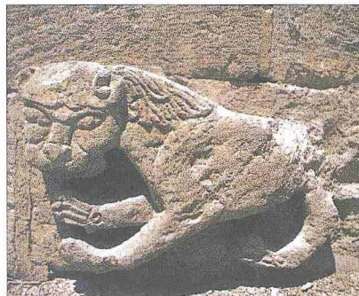
Kahire'de Burcû's-sika cephesinde Sultan Baybars el-Bundukdârî'nin rengi aslan kabartması ile Mencek el-Yûsufî Silâhdar Sarayı kapısında silâhdarın rengi kılıç

Renklerin yer alacağı genellikle daire şeklindeki zemin "şatfe" denilen yatay çizgilerle ikiye, üçe veya satranç tahtası biçiminde karelere ayrılırdı. Hükümdarın renkleri (er-rünûkü's-sultâniyye) bayrak üzerine işlenir, paralara basılır, kullanılan eşyaya özelliğine göre ahşap veya taşsa oyma, cam veya seramikse boyayıp fırınlama, kumaşsa boyama veya aplike, halıysa dokuma, metalse çalma veya kakma tekniğiyle nakşedilirdi. Bu armalar saray, medrese, hastahane, dükkân gibi binaların cephelerine kabartma olarak yerleştirilirdi. Yine çeşitli renklerdeki armalar at ve develerin eyer ve semerlerinin üzerindeki kumaşlara nakşedilirdi. Değerli madenlere nakşedilen renkler sultan veya önemli biri karışılırken şehrin girişlerine, temizlenip