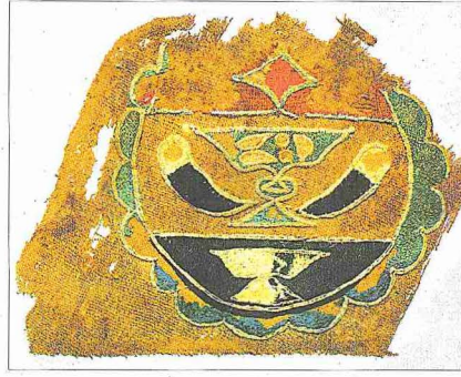
Üzerinde renk işlenmiş XV. yüzyıl sonlarına ait yün kumaş (New York Metropolitan Sanat Müzesi, nr. 1972.120.3)

Muhammed b. Kalavun döneminden itibaren mürekkep renk kullanılmaya başlanmıştır. Mürekkep renklerin bazılarında emirlerin üstlendikleri görevlerin tamamını sembolize eden armalar bir araya getirilmiştir. Kayırbay ve daha sonra tahta çıkan emirleri Canbolat ve Kansu Gavri tarafından kullanılan renkte daire şeklindeki zemin iki şatfe ile üç alana ayrılmış, üstte bohça, iki şatfe arasında büyük bir kadeh, kadehin üst tarafına yazı takımı, iki yanına ayağına doğru uzanan boynuz şeklinde iki kısa hançer, alttaki bölümde yayvan bir kadeh figürü yer almaktadır (a.g.e., s. 108, lv. 39, 123, 240, s. 241, lv. 124).