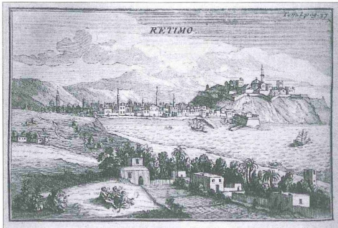
XVIII. yüzyılda Resmo'yu tasvir eden J. P. Tournefort'un bir gravürü