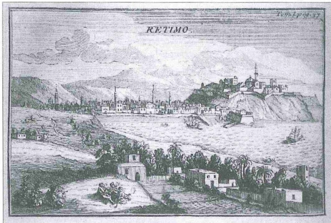
XVIII. yüzyılda Resmo'yu tasvir eden J. P. Tournefort'un bir gravürü