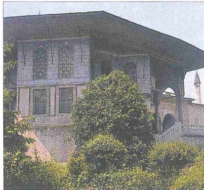
Revan Köşkü (Topkapı Sarayı)

İstiklal Bulut, Revan Köşkü (mezuniyet tezi, 1958), İÜ Ed. Fak. Sanat Tarihi bölümü; R. Ekrem Koçu, Topkapı Sarayı , İstanbul, ts., s. 43; Sedat Hakkı Eldem, Köşkler ve Kasırlar , İstanbul 1969, I, 287-298; Hülya Tezcan, Köşkler , İstanbul 1978, s. 15-17; Güncüt Akın, Asya Merkezi Mekan Gelenegi , Ankara 1990, s. 131; Nadide Seçkin, Topkapı Sarayı'nın Biçimlenmesine Hakim Olan Tasarım Gelenekleri Üzerine Bir Araştırma (doktora tezi, 1990), İstanbul Teknik Üniversitesi Fen Bilimleri Enstitüsü, s. 113; O. Grabar, "The Architecture of Power: Palaces, Citadels and Fortifications", Architecture of the Islamic World (ed. G. Michell), Hong Kong 1991, s. 48-79; G. Goodwin, "Key Monuments of Islamic Architecture (Turkey)", a.e., s. 237-245; Hasan Fırat Diker, Topkapı Sarayı'nda Revan ve Bağdat Köşkləri (yüksek lisans tezi, 2000), İstanbul Teknik Üniversitesi Fen Bilimleri Enstitüsü; a.mlf., "Revadîr Revan Köşkü'ne", Mimarist , IV/12, İstanbul 2004, s. 21-24; Ahmet Vefa Çobanoğlu, "Osmanlıda Baş Mimarlar", Türk Dünyası Kültür Atlası: Osmanlı Dönemi , İstanbul 2002, IV, 287, 294-301; Abdurrahman Şeref, "Topkapı Sarayı Hümayu-