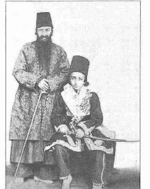
Rızâ Kuli Han Veliaht Muzafferüddin Mirza ile

Eserleri. 1. Ravzatü's-şafâ-yi Nâsirî . Mîrhând'ın Ravzatü's-şafâ adlı eserini 1853 yılına kadar getiren, çoğu neşredilmemiş kaynaklarla resmî belgelere dayanan 60.000 beyitlik bir eserdir; sadece siyasi hadiselerle değil coğrafyaya, edebiyata ve sanata dair pek çok bilgiyi ihtiva eder (I-III, Tahran 1270-1274/1853-1857). 2. Mecma'u'l-fuşahâ . Ebû'l-Abbâs-i Merzevî'den (ö. X. yüzyılın başları) 1284 (1867-68) yılına kadar şairlerin biyografisini ve şiirlerinden örnekleri içeren eser İran şiir tarihinin ana kaynaklarından biridir. Bir mu-