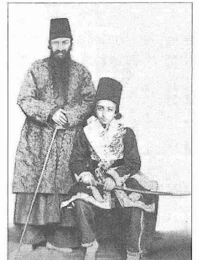
Rızâ Kuli Han Veliaht Muzafferüddin Mirza ile

Eserleri. 1. Ravzatü's-şafâ-yi Nâşîrî . Mîrhând'ın Ravzatü's-şafâ adlı eserini 1853 yılına kadar getiren, çoğu neşredilmemiş kaynaklarla resmî belgelere dayanan 60.000 beyitlik bir eserdir; sadece siyasi hadiselerle değil coğrafyaya, edebiyata ve sanata dair pek çok bilgiyi ihtiva eder (I-III, Tahran 1270-1274/1853-1857). 2. Mecma'u'l-fuşahâ . Ebû'l-Abbâs-i Merzevî'den (ö. X. yüzyılın başları) 1284 (1867-68) yılına kadar şairlerin biyografisini ve şiirlerinden örnekleri içeren eser İran şiir tarihinin ana kaynaklarından biridir. Bir mu-