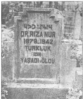
Rıza Nur'un Merkezefendi Mezarlığı'ndaki kabri ve kabir taşı