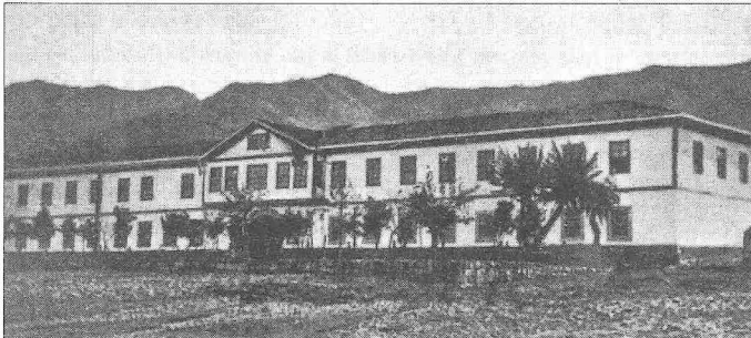
Rize Nizâmiye Kışlası'nın XIX. yüzyıl sonlarına ait fotoğrafı

1936'da il merkezi olduktan sonra giderek gelişen Rize'nin nüfusu 1955 yılına kadar 20.000'i bulmazken (1955 sayımında 17.871 nüfus) 2000 yılında 78.144'e, 2007 yılında 94.800'e ulaşmıştır. Rize şehrinin merkez olduğu Rize ile Artvin, Erzurum, Bayburt ve Trabzon illeri ve kuzeyden Karadeniz ile çevrilmiştir. Merkez ilçeden başka Ardeşen, Çamlıhemşin, Çayeli, Derepazarı, Fındıklı, Güneysu, Hemşin, İkizdere, İyidere, Kalkandere ve Pazar adlı on bir ilçeye ayrılır. 3922 km 2 genişliğindeki Rize