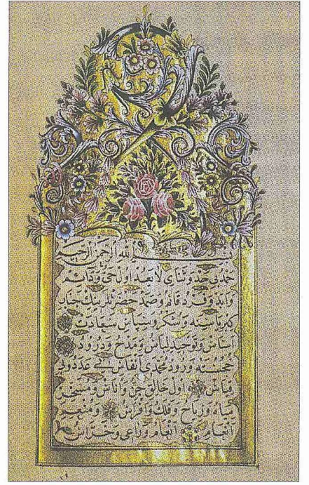
Rokoko süslemeli bir serlevha (TSMK, Mehmed Reşad, nr. 901)

Öte yandan tezhip sanatının XVIII. yüzyılın ortalarından itibaren Fransız rokocosunun tesiri altına girdiği görülmektedir. Bu dönemde klasik kompozisyonlar yavaş yavaş terk edilmiş, kitap süslemelerinde "C" ve "S" kıvrımlarından oluşan formlarla beraber kurdeleyle bağlanan çiçek demetleri, vazolu çiçekler gibi rokokonun yeni motifleri yer almaya başlamıştır. Bu tarzda yapılan süslemelerin en güzel örneklerinin hilye ve diğer hat levhalarında bulunduğu söylenebilir. Kazasker Mustafa İzzet Efendi'nin 1870 ve 1873'te, Filibeli Ârif Efendi'nin 1888'de yazdığı hilye-i şeriflerdeki rokoko tezhipler bunların en önde gelenleridir. Ayrıca bu dönemde Türk sanatında şükûfe tarzı adını alan, natüralist anlayışta bir çiçek süslemesi akımı ortaya çıkmıştır. Ancak bu akımın sadece Fransız rokocosunun uzantısı Batı taklidi olduğu söylenemez. Bunda Türk sanatçıların geçmişten aldıkları zengin desen bilgisinin de etkisi büyüktür. Topkapı Sarayı Harem Dairesi'ndeki yemiş odasının süslemeleri, Ali Üsküdarî tezhipleri, ruganî cilt