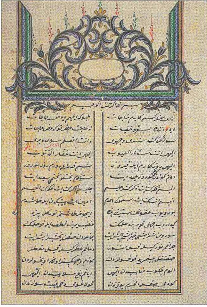
Dede Ömer Rüşenî'nin eserlerinden oluşan mecmuanın ilk sayfası (Süleymaniye Ktp., Dügümlü Baba, nr. 419/2)

vâhid, ahad, samed) ilâvesiyle on iki isimle yapılmaktadır. Bazı kaynaklarda bu on iki isim "İâ ilâhe illallah, Allah, hû, hak, hay, kayyûm, samed, basîr, gafûr, kâhhâr, vedûd, vehhâb" şeklinde kaydedilmiştir (Harîrîzâde, II, vr. 68 b ). Halvetiyye tarikatında on iki isimle seyrü sülûkü ilk defa Dede Ömer Rüşenî tamamlamış, müridlerini de bu usulle yetiştirmiştir. Önde gelen halifelerinden İbrâhim Gülşenî ile oluşan Gülşenîyye ve Muhammed Demirtaşî ile meydana gelen Demirtaşîyye kollarında da bu usul takip edilmiştir. Sıkı bir zühd ve riyâzet esasına dayanan ve Halvetiyye gibi Sünnî bir çizgiyi takip eden Rüşenîyye'de on iki isimle seyrü sülûk yapılmasını J. Spencer Trimingham'ın Şii İsnâaşeriyye ile irtibatlandırma gayretinin ilmî bir dayanağı yoktur.