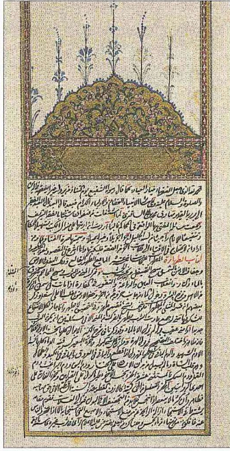
Sakızlı Sâdik Mehmed Efendi'nin Surretü'l-fetâvâ adlı eserinin ilk ve son sayfaları (Süleymaniye Ktp., Lâleli, nr. 1254)