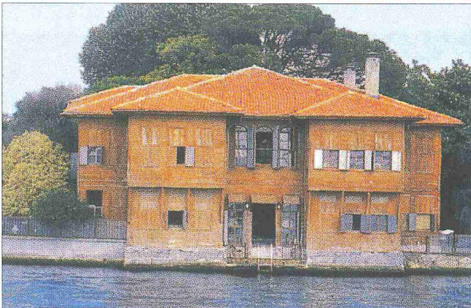
Sâdullah Paşa Yalısı - Çengelköy / İstanbul

İki katlı yalı merkezî sofalı plan tipindedir. Birbirine kesişen iki eksen düzenine göre tamamen simetrik bir plan gösterir. Denize paralel biçimde konumlanmış merkezî sofanın köşelerine yerleştirilen ikişer adet oda ve sofaya deniz ve bahçe yönünden saplanan eyvanlar planın temelini oluşturur. İki katın planı da birbirini küçük bir farkla tekrar eder. Alt kat sofası köşeleri pahlanmış dikdörtgen, üst kat ise oval şekilli bir sofaya sahiptir. Sofalar uzunlamasına denize paraleldir. Üst kat sofasını bir