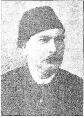
Sâlih Dede Efendi

vîhâne Maçka'ya nakledilince Maçka Mevlevîhânesi, oradan Eyüp'te Bahariye'ye nakledilince Bahariye Mevlevîhânesi ve bu arada Kasımpaşa Mevlevîhânesi neyzenbaşılıklarını yaptı. Güçlü bir ney icracısı diye tanınan Sâlih Dede, Türk mûsikisi bölümü sonradan kurulan Muzıkâ-i Hümâyûn'a neyzen olarak girdi (1840) ve burada ney hocalığı ve icracılığı görevlerinde bulunarak kaymakam (yarbay) rütbesine kadar yükseldi. Kaymakam olduğu için Sâlih Bey diye tanındı. Abdülmecid döneminde fasıl heyetinde çalışmasının ardından Abdülâzîz'in tahta çıkmasından az önce kadro kıstılaması sebebiyle emekliye ayrıldı. Kaynaklar, vefatıyla ilgili olarak Suphi Ezgi'nin tahmini olan 1888 yılını vermektedirse de M. Nazmi Özalp herhangi bir kaynak göstermeden onun 17 Eylül 1887 tarihinde öldüğünü söylemektedir ( Türk Mûsikîsi Tarihi , I, 585). Sâlih Dede Efendi Kasımpaşa Mevlevîhânesi'nin mezarlığına defnedildi (a.g.e., a.y.). Muzıkâ-i Hümâyûn hocalarından olduğu için babası ve ağabeyi gibi şeyh olamamıştır.