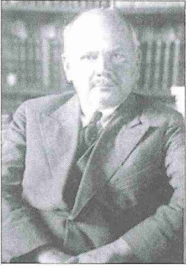
Aleksandr Nikolaevič Samoylovič

çalışmalarla Türkoloji alanına büyük katkılar sağlamıştır. Özellikle onun ses denkliklerini ölçü alarak Türk lehçelerini r grubu (Bulgar), d grubu (Uygur-Kuzeydoğu), Tav grubu (Kıpçak-Kuzeybatı), Tağlık grubu (Çağatay, Güneydoğu), Tağlı grubu (Kıpçak-Türkmen, Orta), ol- grubu (Türkmen-Güneybatı) adlarıyla beş ana dalda tasnif ettiği Nekotorye dopolnenija k klassifikacii tureckix jazykov (Türk dillerinin sınıflandırılması üzerine bazı ilâveler; Petrograd 1922) başlıklı eseri Türkoloji alanında önemli bir yere sahiptir. Samoyloviç'in Opyt kratkoj krymsko-tartkoj grammatiki (kısa bir Kırım-Tatar grameri denemesi; Petrograd 1916); Rukovodstvo dlja praktičeskogo izučenii osmansko-tureckogo jazyka (Osmanlı dilini pratik olarak öğrenme kılavuzu; Petrograd 1916); Sobrajne stixotvorenij imperatora Babura (İmparator Bâbü'r'ün şiirleri; Petrograd 1917) adlı eserleriyle Kırız ve Kazak dillerinde evli kadınlara yasak olan sözler, Altay Türkleri'nde kadınlara özgü kelimeler, Türkçe'deki asıl sayılar ve yorumlarının özeti, Türk dillerindeki zengin ve fakir, Türk halklarında hafta günlerinin adlandırılması konularında kalem aldığı makaleleri, Türk dili ve edebiyatıyla ilgili özgün çalışmalar olmaları bakımından ayrı bir öneme sahiptir.