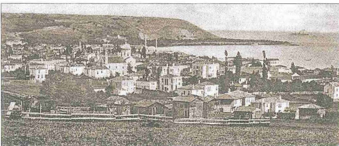
XX. yüzyıl başlarında Samsun'u gösteren bir kartpostal

Samsun özellikle Millî Mücadele açısından önemli bir mevkiye sahiptir. Daha Balkan savaşları sırasında sadakatlerinin Osmanlı Devleti'ne değil Yunanistan'a olduğunu açıkça ortaya koyan ve Doğu Kara-