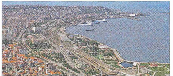
Samsun'dan bir görünüşü