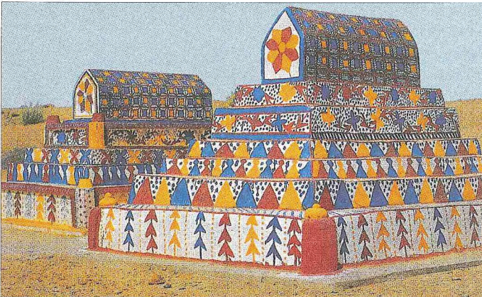
Çevkundi (Chaukundi) Mezarlığı'nda sandukalı kadın mezarları – Karaçi / Pakistan