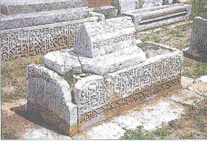
Eski Erciş'te Çelebibağ Mezarlığı'ndaki taş lahitlerden bir örnek

vayet edilir (DİA, XXXII, 486). Burada daha sonra Hârûnürreşîd bir türbe inşa ettirmiştir. Zamanla kabrin üstüne sedef kakma ahşaptan kenarları ahşaba geçen cam gibi çok değişik sandukalar yapılmıştır.