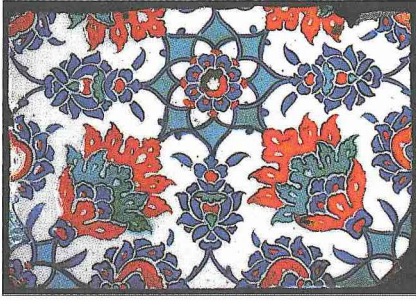
Edirne'de Sarây-ı Cedid çini duvar panolarına bir örnek

rica su terazisinin 300 m. kuzeyinden başlayarak Saraçhane Köprüsü'ne kadar Tunga nehrinin iki sahiline Fâtiḥ Sultan Mehmed tarafından rıhtımlar inşa ettirilmiştir. 2 kilometreden fazla olan, zeminleri mermer döşeli bu rıhtımların taşları daha sonra sökülerek inşaatlarda kullanılmıştır.