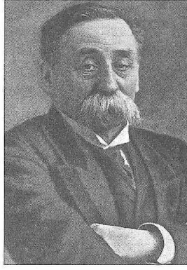
M. Gustave Schlumberger

Schlumberger'in yazdığı pek çok eser arasında 1884'te İstanbul gezisi sırasında gündelik hayatla ilgili gözlem, izlenim ve derlediği tarih notlarından oluşan İstanbul adalarıyla alâkalı Les îles des princes, la palais et l'église des blachernes, la grande muraille de Byzance, souvenirs d'orient adlı eseri (Paris 1884) halkevlerinin İstanbul şubesi tarafından İstanbul Adaları adıyla Türkçe'ye çevrilmiş (trc. N. Yüngül, İstanbul 1937), daha sonra Prens Adaları ismiyle tekrar yayımlanmıştır (haz. H. Çağlayaner, İstanbul 1996, 2000). 1914'te kaleme aldığı La siégle, la prise et le sac de Constantinople par les turcs en 1453 isimli kitap (Paris 1914) İstanbul'un Muhasarası ve Zabtı 1453 Sene-i Milâdiyyesi ismiyle Türkçe'ye çevrilmiş (trc. M. Nahid, İstanbul 1330), daha sonra İstanbul Düştü Ben Hâlâ Ayakta mıyım? Bir Fethin Anatomisi adıyla yeniden yayımlanmıştır (çev. Hamdi Varoğlu, İstanbul