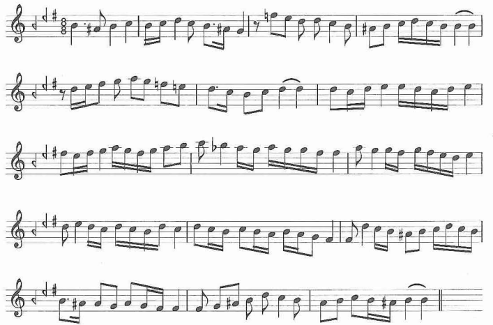
Segâh makamı seyir örneği

Macarca Szeged, Latince Segedin şeklinde anılan şehir Tisza ve Maros (Mureş) ırmaklarının birleştiği yerde Macaristan, Romanya, Sırbistan sınırı yakınında yer alır. Macaristan'ın dördüncü büyük şehri olup (2001 sayımına göre 168.271 kişi) Csongrâd ilinin merkezidir. Bulunduğu topraklar Paleolitik çağdan beri bir yerleşim yeridir. Arkeolojik bulgulara göre Macarlar'ın yerleşmesinden önce şehir dolayında İskitler, Keltler, Germanler, Hunlar ve Avarlar yaşamıştır. Romalılar çağında Maros ırmağının kıyısında Partiskon adlı bir ileri karakolun varlığı tesbit edilmişse de şehrin Macarlar'ın gelişinden sonra kurulduğu belirtilir. Yazılı belgelerde adı ilk defa 1183 yılında Cegeddin biçiminde geçer. Ortaçağ boyunca üç yerleşim biriminden oluşuyordu; bunlar Szeged, Alszege (aşağı Szeged) ve Felszege (yukarı Szeged) idi (bu üç bölge 1469'da birleşmiştir). Moğol saldırısı sırasında (1241) şehrin çevresinde henüz bir