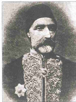
Selim Sâbit Efendi

Selim Sâbit Efendi öğretmenlerin sahip olması gereken niteliklerle ilgili bazı görüşler de ileri sürmüştür. Ona göre öğretmenler yirmi beş yaşından genç olmamalı, edep sahibi, sabırlı, şefkatli, olgun ve iyi ahlâklı olmalıdır. Rousseau'nun Emile