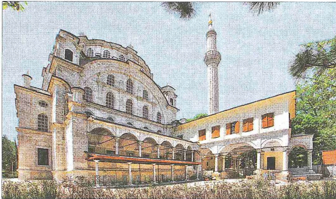
Selimiye Camii - Üsküdar / İstanbul

III. Selim tarafından Üsküdar'daki Kavak Sarayı arazisinde yaptırılan külliye, binalarının çeşitliliği ve kapsamı ile geleneksel sultan külliyesi anlayışının dışındadır. Tamamı III. Selim'in şahsî servetiyle inşa edilen Selimiye Camii, yanında mektep, Nakşibendî zâviyesiyle içinde mescid (Küçük Selimiye Camii; bk. SELİMİYE TEKKESİ), dârürrütibâa, hamam, doksan yedi dükkân, on mesken, meşruta, dört çeşme, kerestehane, mumhane, beş boyacı ile bir iplik ağartıcılar yeri, kırk sekiz-kırk dokuzar odalı yedi ayrı sandalcılar (ipekli dokuma) hanı, pınar esnafı hanı ve francala fırını yaptırılmıştır. Ayrıca Harem İskeleyi ticarî iskeleye dönüştürülerek kayıkçı ve hamal odaları inşa edilmiştir. Bu yapıardan cami, hamam, muvakkithâne, sıbyan mektebi ve bir çeşme günümüze ulaşmıştır. Selimiye Külliyesi'ne mimarlık ve şehircilik tarihi açısından önem kazandıran en önemli olgu, birbirini dik kesen sokaklarıyla kentsel ölçekte tasarlanmış bir yerleşim alanının düzenlenmiş olmasıdır. Selimiye yerleşim