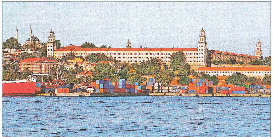
Selimiye Kışlası - İstanbul

İnşaat defterine göre benzersiz biçimde ve "yoktan var edilerek" (îcad ve ibda') yapıldığı ve kütlenin büyük olduğu ifade edilmiştir. Burada diğer kışlalardan farklı şekilde bir mehter bölümü, topçular ve süvari birliği bulunur. Askerler fenn-i hendese kurallarına göre eğitilir. Nizâm-ı Cedîd kapsamında kurulan Anadolu kışlalarından askerler getirilerek burada tâlim yaptırılmıştır. 1807'de Kabakçı Mustafa ayaklanmasıyla Nizâm-ı Cedîd hareketine son verildiğinde kışlanın han yapılması için فرمان çıkmış, süslemeli kapı saçakları yıkılmıştır. Temmuz 1808'de II. Mahmud tahata çıktıktan sonra onarılan bina Sekbân-ı Cedîd askerlerine tahsis edilmiştir. Kasım 1808 isyanında yeniçeriler tarafından "külliye ve bir daha bina olunmamak üzere" yıkılmış, 1809'da enkazı ve arazisi satışa çıkarılarak tarihten tamamen silinmeye çalışılmıştır.