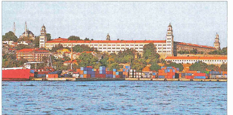
Selimiye Kışlası - İstanbul

İnşaat defterine göre benzersiz biçimde ve "yoktan var edilerek" (îcad ve ibda') yapıldığı ve kütlenin büyük olduğu ifade edilmiştir. Burada diğer kışlalardan farklı şekilde bir mehter bölümü, topçular ve süvari birliği bulunur. Askerler fenn-i hendese kurallarına göre eğitilir. Nizâm-ı Cedîd kapsamında kurulan Anadolu kışlalarından askerler getirilerek burada tâlim yaptırılmıştır. 1807'de Kabakçı Mustafa ayaklanmasıyla Nizâm-ı Cedîd hareketine son verildiğinde kışlanın han yapılması için فرمان çıkmış, süslemeli kapı saçakları yıkılmıştır. Temmuz 1808'de II. Mahmud tahata çıktıktan sonra onarılan bina Sekbân-ı Cedîd askerlerine tahsis edilmiştir. Kasım 1808 isyanında yeniçeriler tarafından "külliye ve bir daha bina olunmamak üzere" yıkılmış, 1809'da enkazı ve arazisi satışa çıkarılarak tarihten tamamen silinmeye çalışılmıştır.