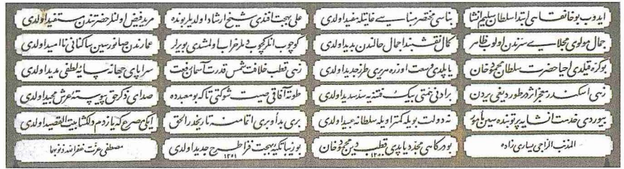
Selimiye Tekkesi'nin avlu kapısı üzerindeki kitâbe

Simetrik bir düzenlemeye sahip harimin güney duvarında eksende yarım daire plan-