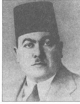
Abdürrezzâk Ahmed es-Senhûrî

Arap Birliği'ne bağlı Arap Araştırmaları Enstitüsü'nde karşılaştırmalı hukuka dair verdiği derslerden Meşâdirü'l-hak fi'l-fıkhi'l-İslâmî adlı önemli eseri ortaya çıkmıştır. Bu eser modern müslüman hukuk-