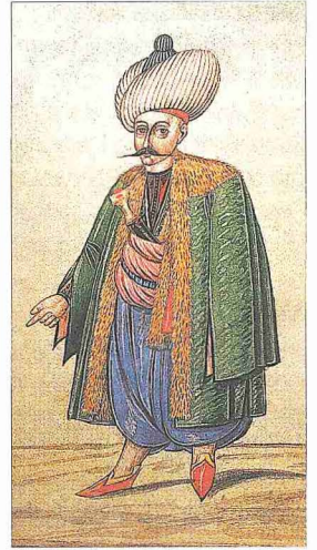
Son dönem serdengeçti ağası

Serdengeçtilik tamamen gönüllü olma esasına dayanıyordu. İhtiyaç zamanında serdengeçti bayrağı açılır, isteyen yeniçeriler bu bayrak altında toplanır ve savaşa katılırdı. XVI. yüzyıl sonlarından itibaren ocak düzeninin bozulması ve savaşların uzaması askere olan ihtiyacı arttırmış, yeniçeriler arasından serdengeçti alınması yanında dışarıdan ve taşrada eyalet ve sancaklarda timarlılardan da serdengeçti almaya başlanmıştır (Defterdar Sarı Mehmed Paşa, s. 438). Ocaktan görevlendirilen kişiler gittikleri yerlerde serdengeçti bayrakları açarlar ve tâlip olanların kayıtlarını yaparlardı. Kaynaklarda yeniçerilerden başka kuloğullarından, cebeci ve topçulardan, garip yiğitlerinden, atlı kapıkulu bölüklerinden de serdengeçti yazıldığı belirtilmektedir. Aslında birkaç yıllığına alınan, ayrı defterlere kaydedilen ve seferde ayrı bir sınıf sayılan bu askerler daha sonra ulûfe defterlerine yazılarak kalıcı şekilde ocağa dahil edilir, çoğu zaman da bu şartla serdengeçti yazılırlardı ( Topçular Kâtibi Abdülkadir Efendi Tarihi , I, 289, 363). Aynı durum diğer yaya ve atlı kapıkulu ocakları için de söz konusudur. 1073 (1663) yılında önceden serdengeçti yazılan gönüllülerden sağ kalanlar Cebeci Ocağı'na alınmış ve Uyvar Kalesi'ne cebeci tayin edilmiştir. Kapıkulu süvari bölüklerine de ihtiyaç halinde serdengeçti alındığı olmuştur. 1061'e (1651) kadar üç yıllığına alınan ve ayrı deftere kaydedilen serdengeçtiler bu seneden itibaren doğrudan ulûfe def-