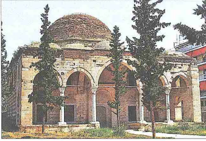
Serez'de Zincirli Camii

ısıyla müslümanların camileri, zâviyeleri, medreseleri kasabanın etrafı surla çevrili kısmının dışında inşa edildi.