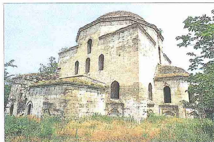
Serez'de Mehmed Bey Camii ve yıkılmış durumdaki son cemaat revakı

Serez'de çıkan iki büyük yangın şehrin harap olmasına yol açtı. 1849'da dörtte üçü yanan şehir, 1913'te Balkan savaşları esnasında Bulgarlar'ın burayı Yunanlılar'a teslim etmesinden hemen önce kundaklama sonucu tamamen harap oldu. 1913-1919 yılları arasında gönüllü Yunan-Bulgar nüfus mübadelesi ve Lozan Antlaşması (1922) neticesinde Yunanistan ile Türki-